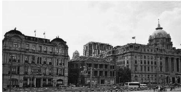
(中央が旧招商局 2017年8月撮影)