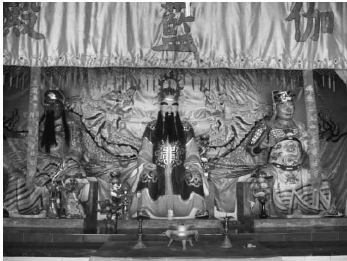
福建福清黄檗山萬福寺の伽藍殿

なお、関帝と華光、それにもうひとつの伽藍神という組み合わせは、福建福清の「古黄檗」萬福寺の伽藍殿にて見ることができる。