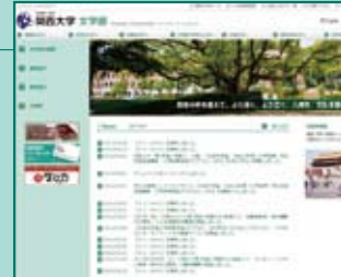
▲文学部ホームページ http://www.kansai-u.ac.jp/Fc_let/

文学部のさらに詳しい情報、最新のトピックスを知るには、「文学部ホームページ」をご確認ください。学部からのメッセージや研究できるテーマなど、学部の学びがわかるコンテンツが満載です。また受験情報なら、入学試験情報総合サイト「Kan-Dai web」へ。圧倒的な情報量と読んで楽しい特集企画で、合格までをサポートします。