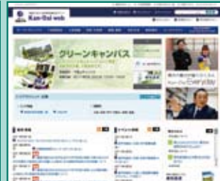
▲入学試験情報総合サイト「Kan-Dai web」 http://www.kansai-u.ac.jp/nyusi/