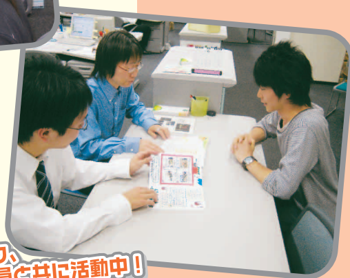
学生スタッフ、職員と共に活動中!

ボランティアセンターでは、みなさんがボランティアにふれるきっかけになるような講座を開講しています。また、日々の生活や社会に出てから役に立つようなものもあります。受講料は全て無料なので、気軽に参加してみてください。