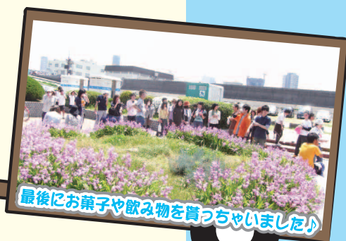
最後にお菓子や飲み物を貰っちゃいました♪