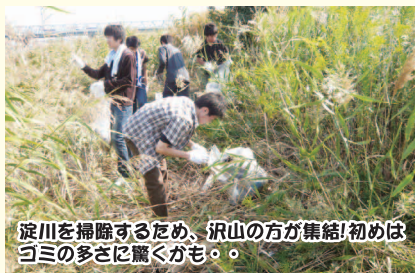
淀川を掃除するため、沢山の方が集結！初めはゴミの多さに驚くかも。

毎月第一日曜日に学生を募って淀川を掃除しに行きます。その活動がどんなものなのか、写真と共に紹介していきます。