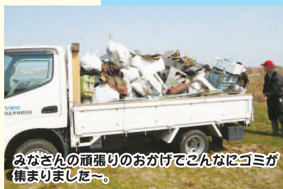
みなさんの頑張りのおかげでこんなにゴミが集まりました～。