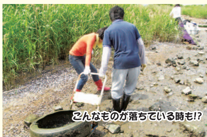
こんなものが落ちている時も!?