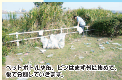
ペットボトルや缶、ビンはまず外に集めて、後で分別していきます。