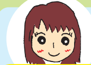
いとちゃん 政策創造・2年次生