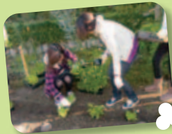
花植えボランティア