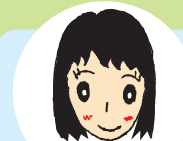
しーちゃん 政策創造・2年次生

まんじゅう。そのころは、外面は白く純情に見られますが中身はいろいろな味があって、一筋縄ではいきません(笑)