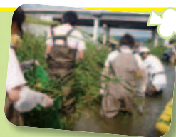
高槻市芥川のみズヒマワリ駆除活動

その他にも高槻市芥川のみズヒマワリ駆除活動や花植えボランティア等多くの活動も行っていきます。