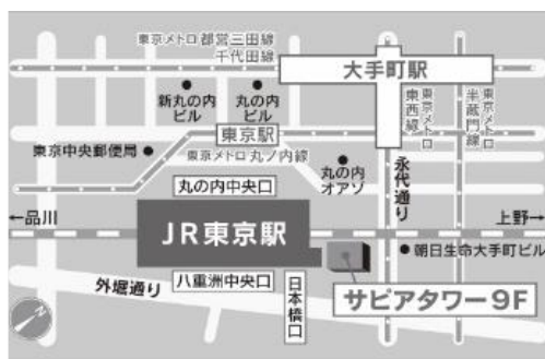
関西大学東京センター地図

違法な盛り土の崩壊が引き起こした大規模土石流。27人が犠牲となり、今も1人が行方不明のままです。被害は何故防ぐことができなかったのか、8000枚の関係資料、熱海市職員と不動産会社との会話とされる録音音声からは、その背景が浮かび上がってきます。また、その後の責任追及と被害者救済はどうなっているのでしょうか。皆様のご来場をお待ちしております。