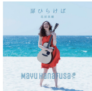
2017年 シングル 「扉ひらけば」