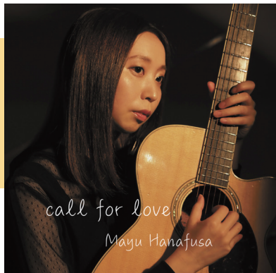
ファースト ミニアルバム 「call for love」 (TKCA-74899)