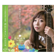
2017年 シングル 「命はじまり」

オフィシャルCDショップ https://mayuofficial.buysshop.jp