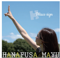
2019年 フルアルバム 「peace sign」