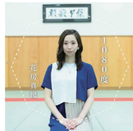
2018年 ミニアルバム 「1080度」