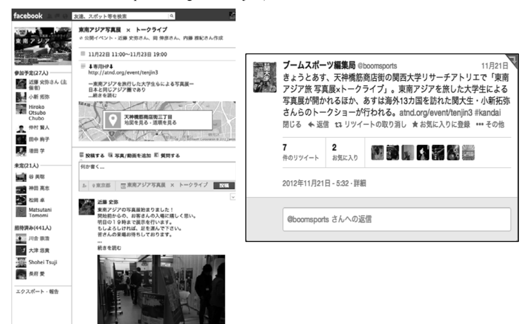
図 5 facebook 告知