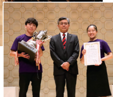
閉会式 総合優勝表彰状授与 (2023年度)