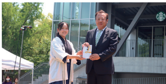
校友会による目録贈呈