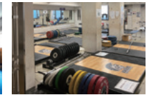
トレーニングルーム (パワージム)