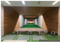
射撃場 (エアライブ)