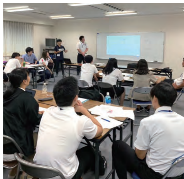
日本体育大学との体育会本部交流会での写真

また、全国の各大学体育会本部組織とも交流会を実施し、大学スポーツの発展について学んでいます。