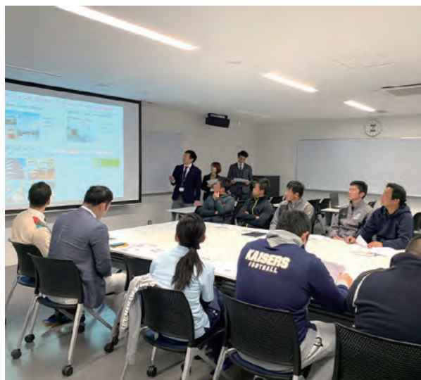
体育会指導者ミーティングの様子