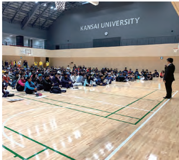
地域の小中学生を対象とした一日クラブ体験の様子

関西大学スポーツ振興センターは、体育会に所属する学生に対して文武両道を目指し、スポーツのみならず、卒業後のキャリアも考え、人としての成長を大切にしています。