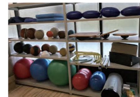
セルフケアグッズはもちろん、スポーツや怪我に関する本なども置いてあります。

水治療法スペース 選手がコンディションを整える為、練習前後などに交代浴を行うスペースです。