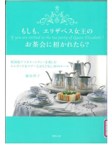
『もしも、エリザベス女王のお茶会に招かれたら？ 英国流アフタヌーンティーを楽しむエレガントなマナーとおもてなし40のルール』 藤枝理子/著 清流出版 596.8/フ