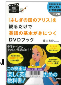
『「ふしぎの国のアリス」を観るだけで英語の基本が身につくDVDブック』 藤田英時/著 アスコム 837/フ