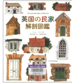
『英国の民家解剖図鑑』 マシュー・ライス/著 岡本由香子/訳 中島智章/監修 エクスナレッジ 523/ラ