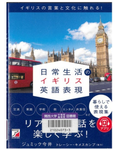
『日常生活のイギリス英語表現 イギリスの言葉と文化に触れる！』 ジュミック今井/著 明日香出版社 837/ジ