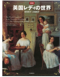
『図説英国レディの世界』 岩田託子・川端有子/著 河出書房新社 384/イ