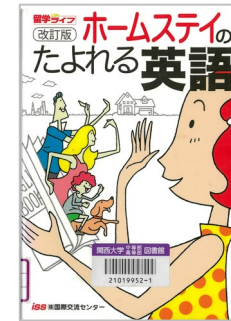
『ホームステイのたよれる英語 ホームステイもこの一冊でもう安心』 小林健/著 ICC (株) 国際コミュニケーションセンター 837/コ