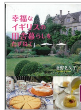
『幸福なイギリスの田舎暮らしをたずねて』 北野佐久子/著 集英社 293.3/キ