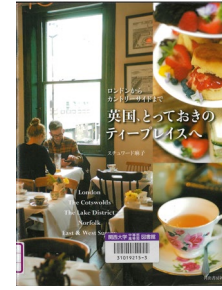
『ロンドンからカントリーサイドまで 英国、とっておきのティーブレイスへ』 スチュワード麻子/著 河出書房新社 596.7/ス