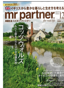
『mr partner 英国生活 ミスターパートナー』