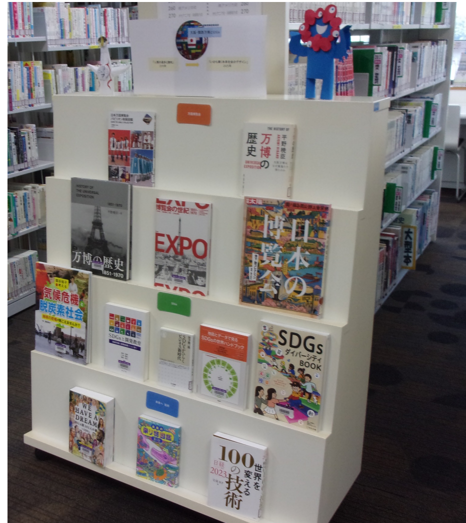
展示の様子：ここで紹介している本が並んでいます。

半世紀以上の時を超えて、また大阪で万国博覧会が開催されます。「人類の進歩と調和」から「いのち輝く未来社会のデザイン」へとアップデートされた万博を楽しむために、万博って何か、SDGsってどういうことか、知ったり考えたりしてみましょう！