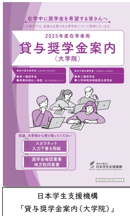
日本学生支援機構 「貸与奨学金案内 (大学院)」