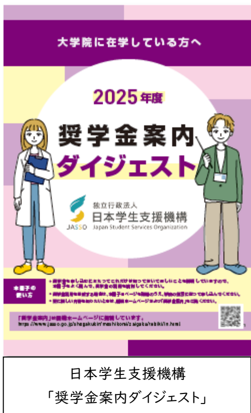
日本学生支援機構 「奨学金案内ダイジェスト」

日本学生支援機構貸与奨学金への出願を希望する場合は、本冊子と併せて、貸与奨学金制度の詳細について以下の奨学金の案内を熟読し、貸与奨学金制度（返還あり）の内容を理解したうえで、期日までに手続きを行ってください。