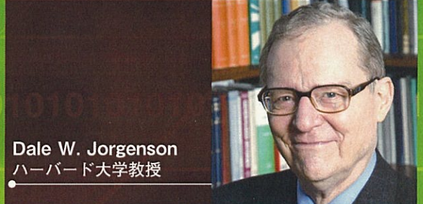
Dale W. Jorgenson ハーバード大学教授