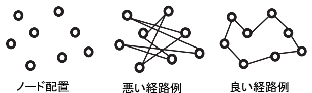
図1 巡回セールスマン問題

図2はネットワークにおけるルーティングの最適設計の応用例であり、トラフィック負荷が特定のリンクに集中しないような経路選択が理論的な裏付けのもとに可能となる。他にも、ネットワークにおける資源配置、トラック輸送経路やスケジュール、ジョブスケジューリング、システムの保守運用の最適化等、ネットワークに限らず、様々なシステムに応用可能である。