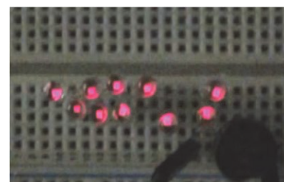
図3. 歩行時のLEDの発光