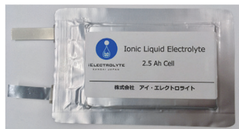
世界最小人工衛星打上げJAXAロケット「SS-520」 5号機に採用されたイオン液体電池

イオン液体のリチウムイオン電池の宇宙運用は、まず2014年6月打ち上げの人工衛星「ほどよし3号」で試験運用。2018年2月JAXA「SS-520」5号機の制御電源として採用され、宇宙空間到達に電源として貢献。