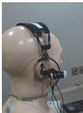
ヘッドマウント型 ANCシステム

NLMSアルゴリズムの論理回路実装は正規化のための除算演算が必要となり回路規模が大きくなる。この除算演算をシフト演算とすることで計算コストを大幅に減らし、近似的に実装することを可能にし、システムの安定性向上を行った。特にFPGAに実装可能となれば、並列処理による高速演算が可能となり、ANCシステムの参照マイクロホンと誤差マイクロホンとの距離を縮めることができ、右図のようなヘッドホン型システムを構築することが可能となる。