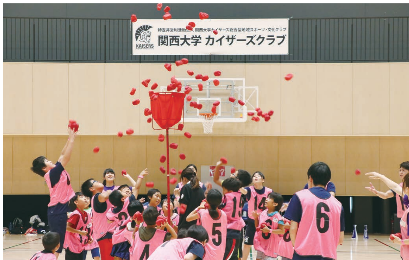
#青少年の健全育成 #社会におけるコミュニティ作り #健康で豊かな生活