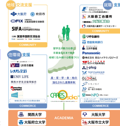
CARES-Osakaの概念図 (2016年12月現在)

CARES (Communal Actions for Resident and Employment Support) by Osaka