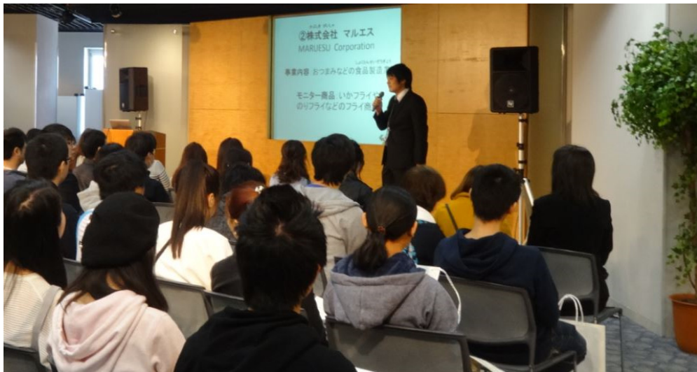
りそな銀行、大阪産業創造館との共催の企業新作商品モニター会

産・官・学・金・地のコンソーシアム「CARES-Osaka」が、留学生にとっての「大阪＝第2のふるさと」を創生することを目指し、留学生が大阪近隣で就職・定住して地域住民と共生するための支援に取り組んでいます。