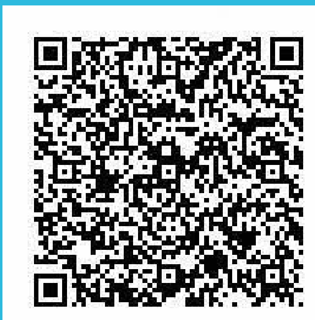
吹田市電子申込システム