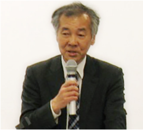
社会人学び直し大学院プロジェクト プロジェクトリーダー/経済学部 教授

海外展開を行う企業には、語学力に加えて、深い異文化理解に根ざした経営戦略を立案できる人材が求められます。具体的には、異文化環境に臆せず飛び込むバイタリティをもち、自律的に課題設定から解決までを行い、現地の人々と対等な関係を築き、企業価値を高めることのできる人材です。本プログラムでは、大学教員が行う専門・教養教育による『理論知』に加えて、企業出身教員による実践的な教育によって『実践知』を学ぶことができます。 これら二つの知を両輪として多様な宗教・価値観が共存する海外での展開を想定した戦略事例を学ぶことで、国・地域に限定されない汎用性をもった真の思考力を養成します。体系化された教育プログラムと徹底したサポート体制で、海外での活躍をめざす社会人のキャリアアップを応援します。