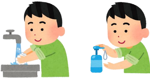
てあら こまめな しょうどく 手洗い・消毒