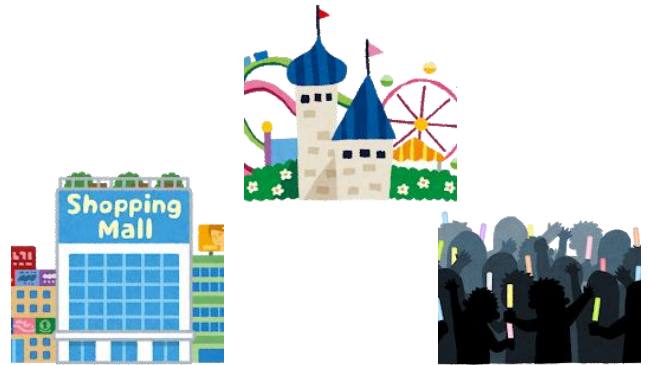
こんざつ 混雑するところにはなるべく い 行かない