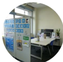
A棟2階 ラーニング・commons