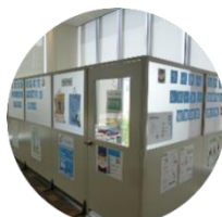
西館2階 ミューズカフェ