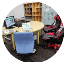
F棟2階 リサーチ・commons (comonエリア)