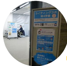
第4学舎ラボの 開室日は ラボのウェブサイトをご確認ください。