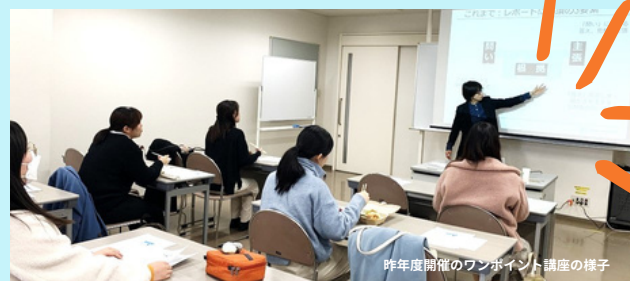
昨年度開催のワンポイント講座の様子