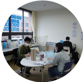
エレベーターホール左側