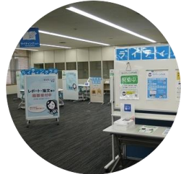
ラーニング・commons ライティング・エリア