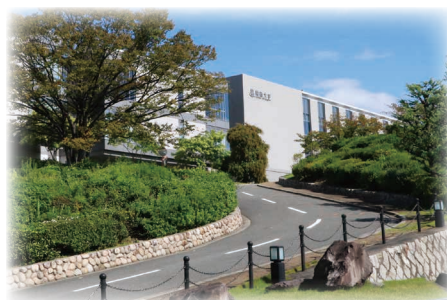
吹田みらいキャンパス