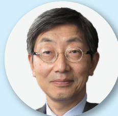
つちだ しゅうじ 土田 昭司

88年関西大学着任。システム理工学部長、大学院理工学研究科長などを歴任し、2012年副学長。同時に研究推進部長、社会連携部長、国際部長を歴任し、2020年10月学長に就任。一般社団法人日本私立大学連盟常務理事などを務める。