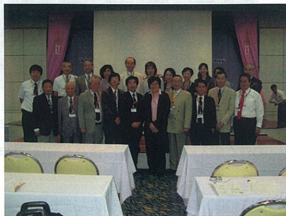
シンポジウム会場での科学技術振興会の皆さん 08.8.19

同大学とは、一昨年に両大学のシンポジウムに同会が後援して訪問したことに始まり、昨年は本学に招待してマレーシアを加えての理工学国際シンポジウムを開催して密接な連携関係を築いてきました。この度は本学から大学院生が若手研究者として初めて参加・発表し、更に交流を深め、国際的な人材育成への一助となるものと思われま