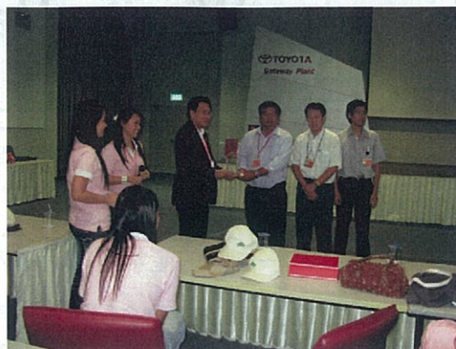
Toyota Motor Thailand (Gateway Plant) 見学後の説明—生産ラインは撮影禁止—08.8.20

見学後、バンコク市内のレストランで泰国千里会から会長始め12名の参加を得て、チュラロンコン大学、タイ国立金属材料研究所、並びに本学から土戸哲明大学院工学研究科長始め教員、学生等、総勢約60名で交流会を開催しました。