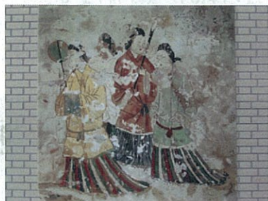
高松塚古墳壁画タペストリー 制作：堺美術織物株 —100周年記念会館設置—