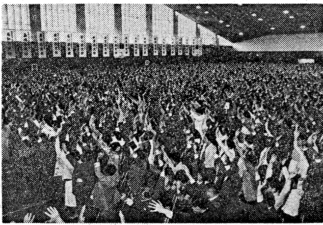
教育後援会の熱気は明日の関大を約束する