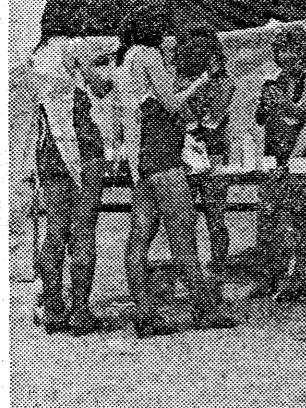
旗も張り、旗もあがった。いよいよ学生たちの活躍の場です。

「学生のみなさん、がんばって勉強してください。皆さんの将来の夢に向かって、自分自身で責任を持って生きてください。母校の皆さん、皆さんの活躍を応援しています。」