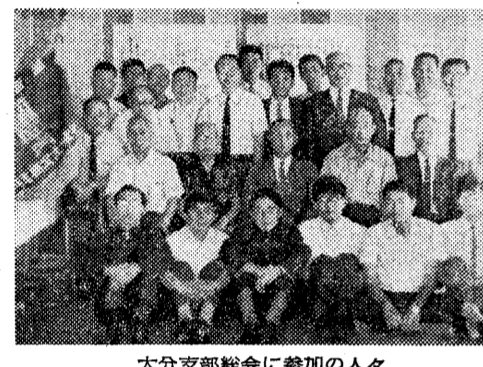
大分支部総会に参加の人々

「オールドボーイ」の放言は、大島鎌吉氏の著書『オールドボーイの放言』の序文である。氏は、戦後日本の教育が、戦前とは異なり、国家主義から民主主義へと大きく転じたことを指摘している。戦前は、教育が国家の利益のために行われ、学生は国家のために犠牲を払うことが求められていた。戦後は、教育が個人の成長と幸福のために行われ、学生は自己実現を求め、社会に貢献することが求められている。氏は、この変化を「オールドボーイ」の放言として、戦前の教育者や学生に対するメッセージとして述べている。 戦前は、教育が国家の利益のために行われ、学生は国家のために犠牲を払うことが求められていた。戦後は、教育が個人の成長と幸福のために行われ、学生は自己実現を求め、社会に貢献することが求められている。氏は、この変化を「オールドボーイ」の放言として、戦前の教育者や学生に対するメッセージとして述べている。