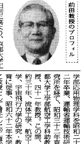
前田弘教授のプロフィール

短距離離着陸機として、現在、航空機の市場に大きな注目を集めている。STOL機は、短距離離着陸機として、現在、航空機の市場に大きな注目を集めている。STOL機は、短距離離着陸機として、現在、航空機の市場に大きな注目を集めている。