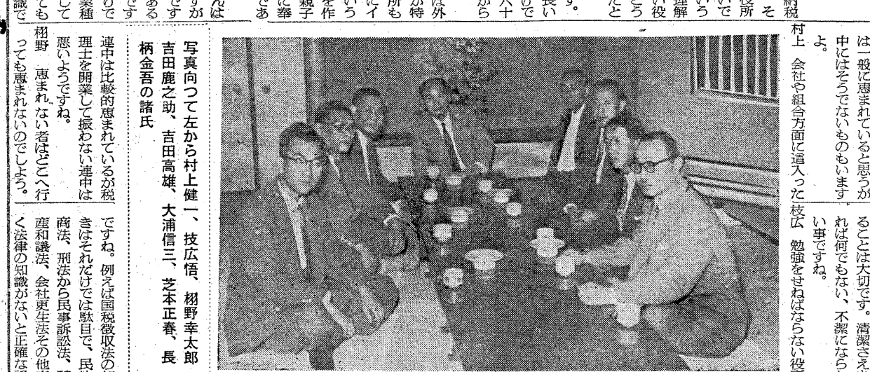
大阪国税局秀麗会の巻

大阪国税局秀麗会は、税務の個別的妥当性を強調し、義務教育から大学までの教育費を徹底せよと訴えている。大阪国税局秀麗会は、税務の個別的妥当性を強調し、義務教育から大学までの教育費を徹底せよと訴えている。