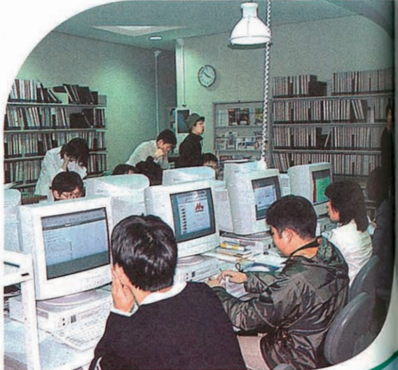
企業情報を収集する就職情報資料室

大学の出口にあたる就職活動、現在卒業年次生の就職、その真只中にある。希望の企業・念願の職種を求めてクルート・スーツが似合うようになってきた。がんばる大生/ 関西大学では多くの行事を通して、就職活動がアップしている。学部での専門分野の勉強や研究、つつとしたサークル活動や文化活動と並行して、自分の