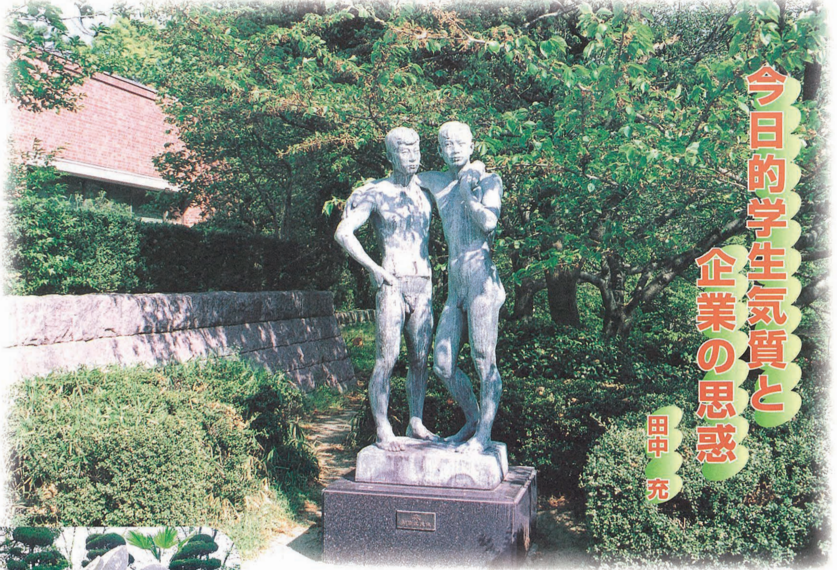
関西大学会館前の「和」のモニュメント