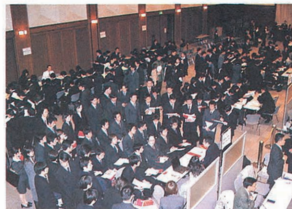
多数の学生でにぎわう合同企業研究会

就職部は就職活動をする4年次生だけを対象としているわけではありません。入学したばかりの1年次生も、クラブやサークル活動に目一杯のあなとも、アルバイトに忙しい人も、ゼミや研究に専心している人も、目標が見つからなくて悩んでいる学生も対象とし、キャリア・デザインという観点から、あなたの学生生活を見直し、また充実させるきっかけを提供します。