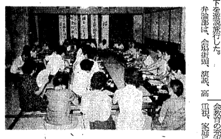
長野県下を遊説する様子

長野県下を遊説する様子。これは、長野県下を遊説する様子を、詳しく紹介している。その目的は、読者に、長野県下を遊説する様子を、詳しく紹介することにある。これは、長野県下を遊説する様子を、詳しく紹介している。