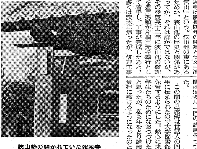
狭山塾の開かれていた報恩寺

爆撃下のペイルート (園田実) ペイルートの町は、戦時中ずっと爆撃の被害を受けた。この町の人々は、苦難を乗り越え、平和を求めた。この本は、その歴史を語り、人々の心を癒す。