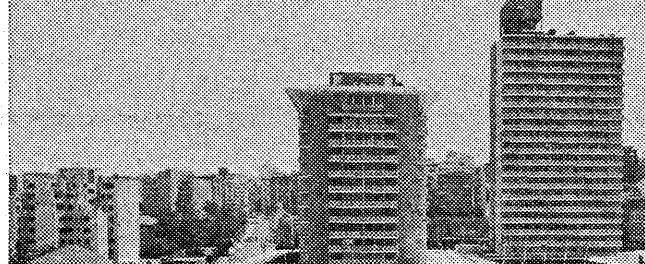
かつてのペイルートの海岸通り

爆撃下のペイルート (園田実) ペイルートの町は、戦時中ずっと爆撃の被害を受けた。この町の人々は、苦難を乗り越え、平和を求めた。この本は、その歴史を語り、人々の心を癒す。