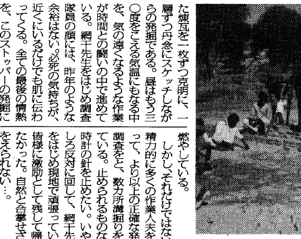
現地を訪れた徳山副会長(右)

「祇園精舎」発掘の中心部、ストウパーの発掘作業が、再び始まる。この発掘作業は、インド政府が、大規模な発掘作業を、大詰めを迎えている。