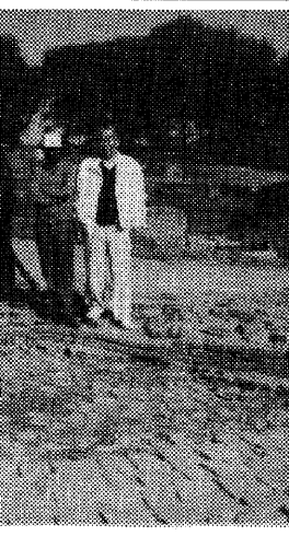
現地を訪れた徳山副会長(右)

「祇園精舎」発掘の中心部、ストウパーの発掘作業が、再び始まる。この発掘作業は、インド政府が、大規模な発掘作業を、大詰めを迎えている。