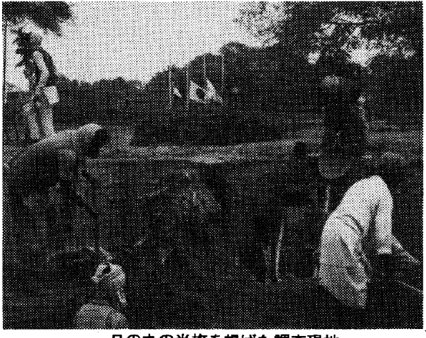
日の丸の半旗を掲げた調査現地

「祇園精舎」発掘の中心部、ストウパーの発掘作業が、再び始まる。この発掘作業は、インド政府が、大規模な発掘作業を、大詰めを迎えている。