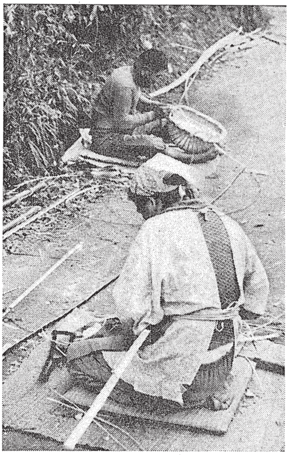
大分県の丁部落。仕事場がないため、堤防の上で仕事をしています。不良住宅も多く、飲み水は井戸水と川の水である。

部落問題は、社会の発展と個人の成長を阻害する大きな課題です。特別措置法の強化と延長を通じて、部落の生活環境を改善し、住民の生活水準を向上させる必要があります。学生は、この問題の重要性を認識し、社会貢献活動を通じて、部落の発展に貢献してください。