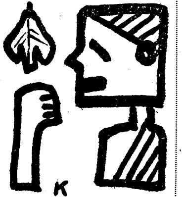
カ ヲ ト 丸 田 君