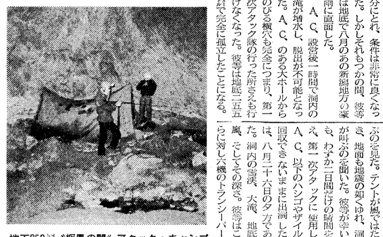
地下250m、"極限の間"アタック・キャンプ