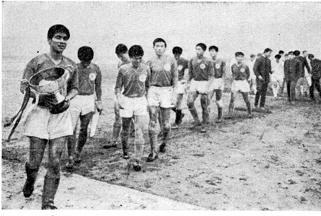
「やったぞ！」…表彰式終了後、なんともいえない喜びの顔

土曜日の午後、東大のサッカー部は、東大サッカー部と対戦し、無失点で勝利した。これは、東大サッカー部の新フォーメーションが成功したことを示している。試合は、東大の攻撃が鋭く、相手の守備を破り、ゴールを奪った。この勝利は、東大サッカー部の士気を大いに高めた。