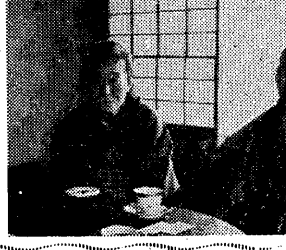
大阪市長白川朋吉氏

白川氏は、大阪市の発展に貢献したと評価されている。この選出は、市民の支持を得た結果である。白川氏は、大阪市の発展に貢献したと評価されている。この選出は、市民の支持を得た結果である。