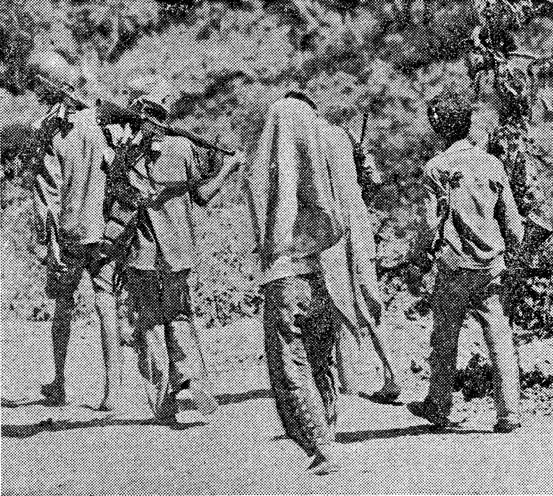
本モノの銃器を手にカッパするブノペン少年兵