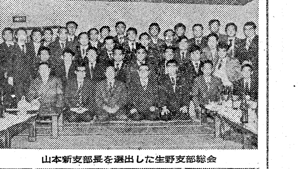
母校の90周年協賛を話し合った声屋支部総会