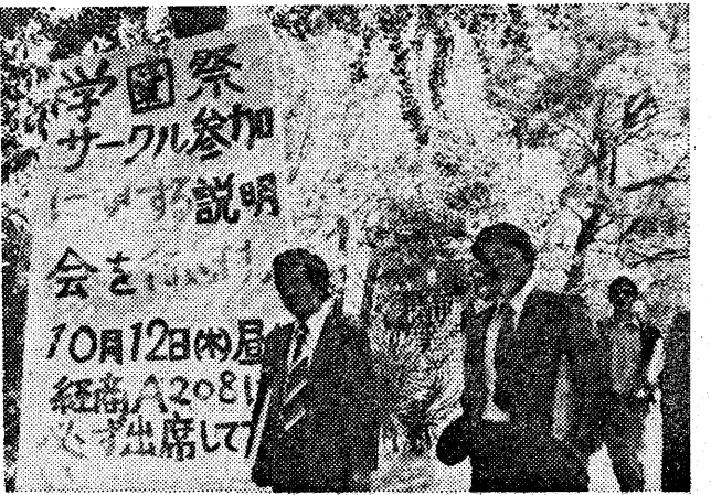
サークル参加を呼びかける学園祭実行委員の看板(校門近くで)

健康手帳。健康手帳は、学生たちの健康を管理するための重要なツールである。今年も、健康手帳の配布が行われ、学生たちの健康維持に貢献している。