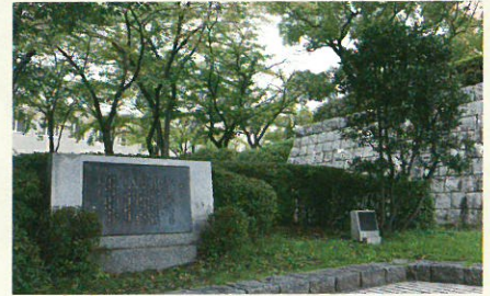
総合図書館前に建つ記念碑と月桂樹