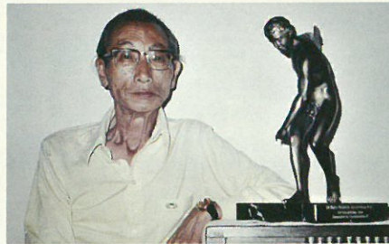
オリンピック平和賞のブロンズ像とともに