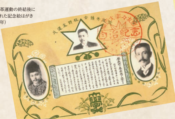
母校改革運動の終結後に 刊行された記念絵はがき (1914年)

そこで、学園紛争を含む関西大学でこれまでに起こった学生運動について、年史編纂室が所蔵する資料から振り返ってみることにしました。学生運動は、発生の要因や経過はさまざま、周囲に大きな影響を与えました。今回はその一部を取り上げたのですが、過去にこのような事象が起こり、それらを克服して現在の関西大学があることを知っていただくきっかけになればと思います。