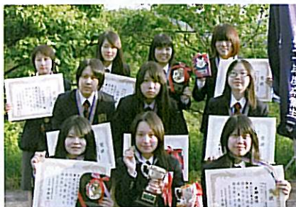
第8回日本学生選抜ライフル射撃選手権大会で 総合優勝した女子選手たち