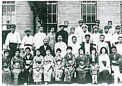
男性に混じって和服姿の女性が目立つ 第1回夏期語学講習会の受講生たち (大正12年)