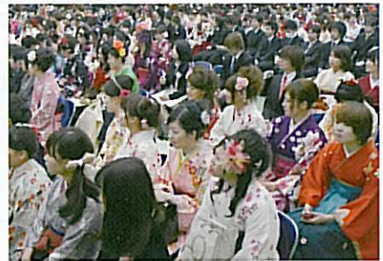
華やかな卒業式 (平成24年)