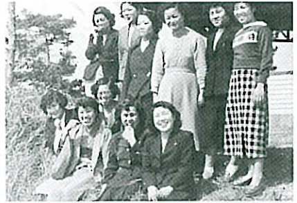
女子学生と卒業生たちの親睦の集い (昭和27年)