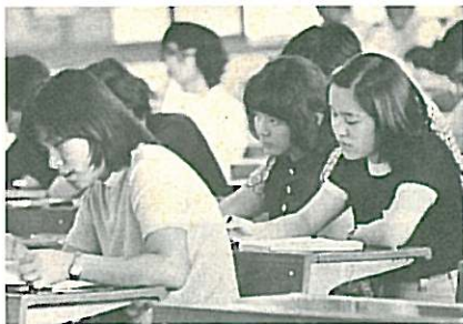
女子学生の姿が目立つようになる昭和40年代後半