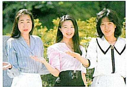
平成元年の女子学生