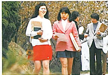
流行のミニスカートでキャンパスを歩く女子学生 (昭和47年)