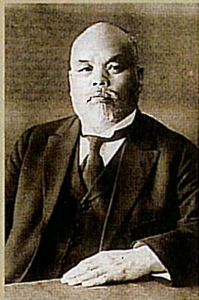
山岡順太郎総理事