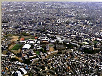
現在の千里山キャンパス