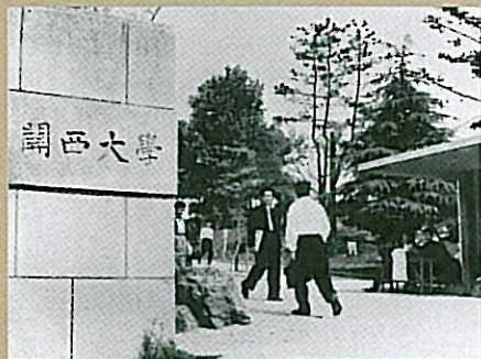
昭和27年に完成した大学正門