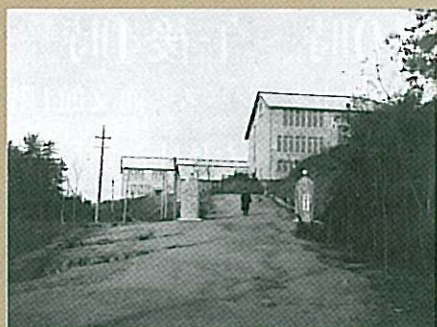
昇格当時の大学正門

今回の企画展では、大学昇格にいたる経緯や当時の様子、昇格を契機に作られた「学歌」や「学報」などについて、パネルや写真で解説するとともに、ゆかりの品を展示いたします。また、学内外の建物や風景から8つを選び、大学昇格のころと現在の景観を対比して紹介しています。見比べて、90年前に想いをさせていただければ幸いです。ちなみに、本企画展のタイトル「燦たる理想をめざして」は学歌の歌詞の一節からとっています。