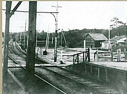
大正12年頃の大学前駅