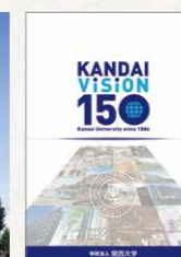
Kandai Vision 150