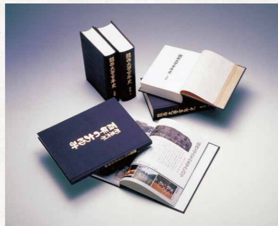
関西大学百年史と関西大学百年のあゆみ

本学ではこれまでに、50年史・70年史・100年史・120年史といった記念誌が編纂されてきました。なかでも100年史は、通史編(上・下)や人物編、資料編、年表・索引から成る充実した内容で、本学の歴史を伝える年史として1つの集大成といえます。また、図版を多く使用し、より読みやすさに配慮した「小史」(70年)や「あゆみ」シリーズ(100年・115年・120年・130年)も刊行されています。