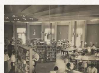
増築された図書館閲覧室