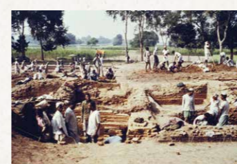
日・印共同学術調査発掘