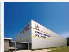
関西大学アイスアリーナ