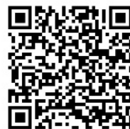
マニュアル (学生用)