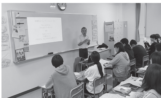
（写真1 模擬国連前の「現代社会」の授業）