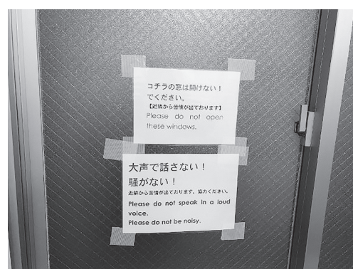
(写真4 日本語・英語表記の注意書き)