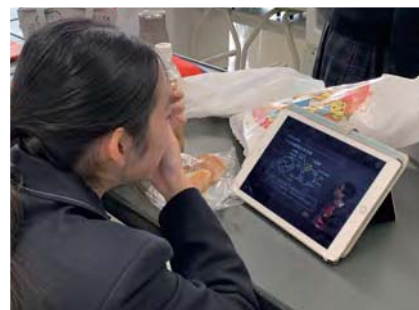
昼食時 ウェブ授業で復習 (動画: https://youtu.be/ihhsYkIEyY )