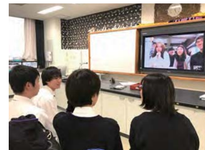
課外活動 韓国の生徒とディスカッション