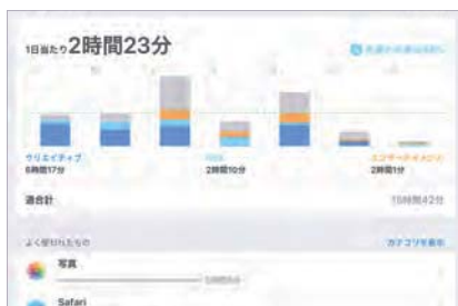
授業中の写真や学習アプリの利用割合が多い

学校・家庭生活をより良くするのも後悔してしまうのも、誰のせいでもなくあなた自身の毎日の積み重ねで決まります。