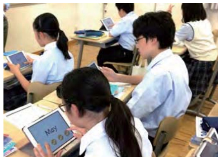
英語 単語習得チェック