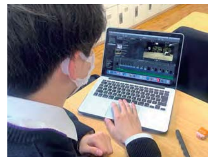
休み時間 動画編集