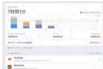
動画やゲームの利用割合が多い