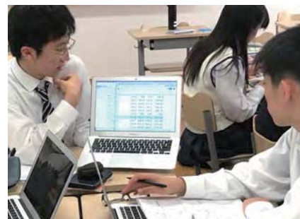
プロジェクト基礎 グループ研究のデータを共有