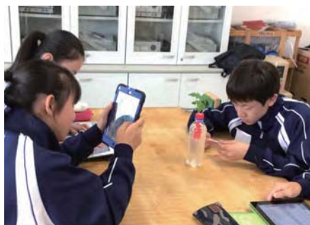
技術 トマトの成長をタイムラプスで記録する