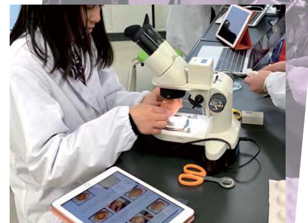
生物 ニワトリの胚発生

このような活用以外にも、部活動、課外活動や生徒会活動においてグループで写真や動画、スケジュール表などを共有し、場所を選ばずに自分のタイミングで様々なことを進めていくことが可能になっています。