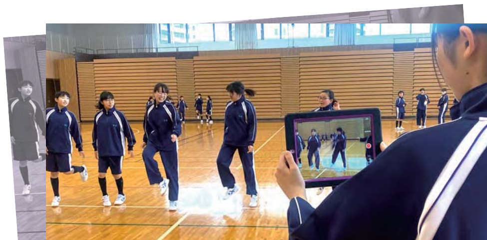
体育 ダンスの練習を記録して動きを確認する