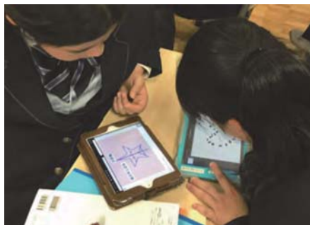
数学 対称についてクラスメイトと考えを共有する