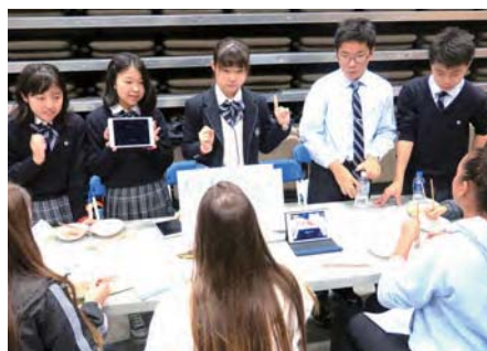
カナダ研修旅行 現地生徒に日本文化を伝える

総合的な学習をはじめとして多くの教科で活用しています。デジタル教科書を利用したり、授業プリントや授業で使ったスライドなどもデバイスで共有して、家庭学習や試験前の振り返りにも活用しています。